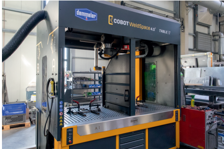
TABLE | 24 12